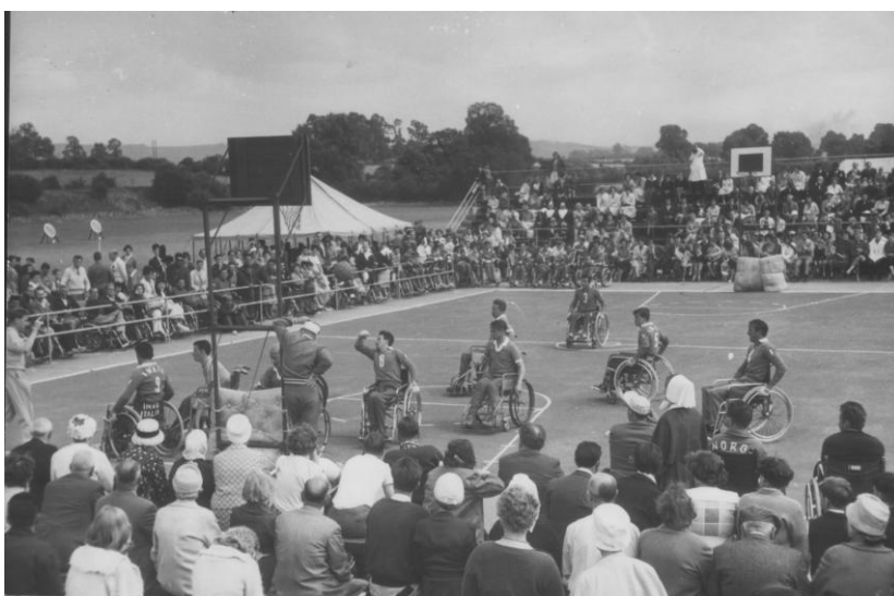
Rollstuhlbasketball-Spiel in Stoke Mandeville (ca. 1950)

Bei den heute um ein Vielfaches professioneller organisierten und durchgeführten Paralympic Games werden die Sportlerinnen und Sportler dennoch mit einer ganz individuellen Einstellung an den Start gehen, zum einen, um ihre eigene maximale Leistung zu zeigen und zum anderen, um auch auf die Rechte und das Können Behinderter aufmerksam zu machen, verbunden mit der Absicht, sie als rundherum wertvolle Menschen zu achten. Negative Randerscheinungen wie das sogenannte „Techno- oder Prothesen-Doping“ sollten nicht ausschlaggebend sein für die Abwen-